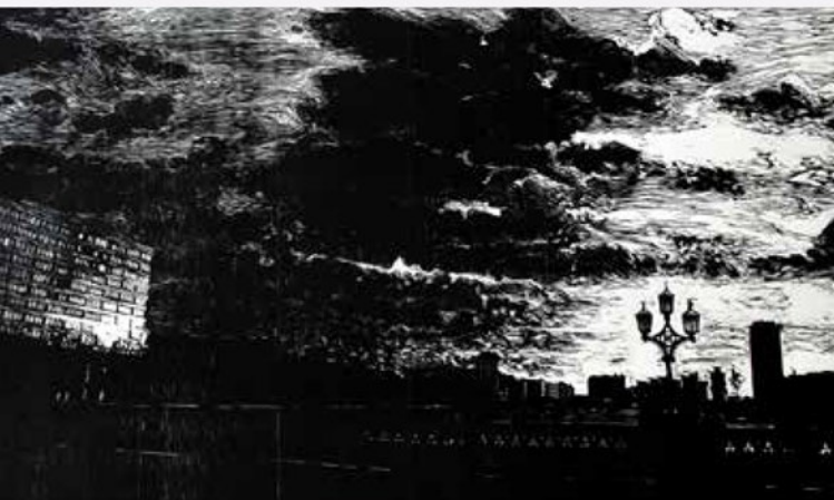
Cosmopolita III. Xilografía, 75 x 100 cm. 2013

El viento se instala en su cabeza para recordarle el movimiento, como un eje conductor de los elementos esenciales de la naturaleza, para abordar el momento desde un intervalo primario, la conformación de los grandes espacios, su traducción al lenguaje del grabado, el punto final donde convive con el infinito.