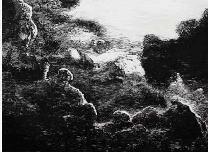
Ventana al cielo. Xilografía, 56 x 77,5 cm. 2014