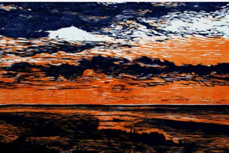
Desde Montjuic. Xilografía, 50 x 65,5 cm. 2012