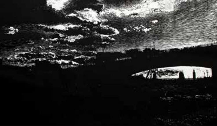
Cosmopolita IV. Xilografía, 75 x 100 cm. 2014