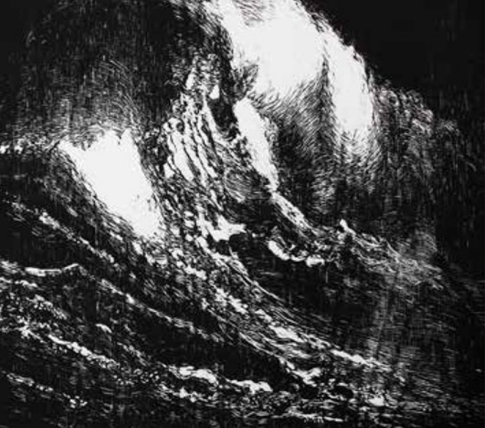
Movimiento de agua. Xilografía, 56 x 62 cm. 2014